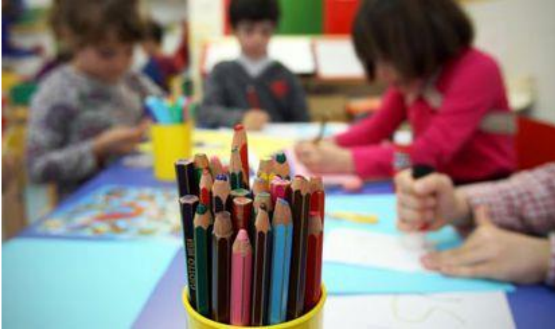
Niños del colegio Aldebarán de Tres Cantos (Madrid).

La Enciclopedia de malos alumnos y rebeldes que llegaron a genios , de Jean-Bernard Pouy, Serge Bloch y Anne Blanchard, pasma con un listado de personalidades que, curiosamente, solo incluye un nombre femenino, Agatha Christie, la reina de la novela negra. El físico Stephen Hawking no aprendió a leer hasta los ocho años; Evariste Galois, padre del álgebra moderna, no pasó dos veces la prueba de acceso a la Escuela Politécnica de París; de John Gurdon, reciente premio Nobel de Medicina, la elitista escuela Eton escribió “no tiene posibilidad de estudiar una especialidad. Sería una pérdida de tiempo para él y para los que deberían enseñarle”; Thomas Edison, inventor de la bombilla eléctrica que obtuvo más de 1.000 patentes, estudió en casa con su madre porque fue expulsado del colegio... La lista es interminable: pintores (Dalí, Picasso, Cezanne, Leonardo), escritores (Dumas, Balzac), músicos (Verdi, Debussy) o mandatarios (Napoleón, Churchill). Y no faltan genios contemporáneos —demostrando que al menos en las últimas décadas el sistema ha fallado— como Larry Ellison, Bill Gates y Steve Jobs.